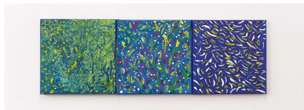
Bilder gemalt von Teilnehmenden des Gedächtnistraining KREATIV.